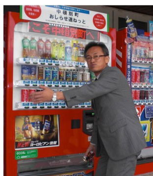
中頓別町(道の駅ピンネシリ)