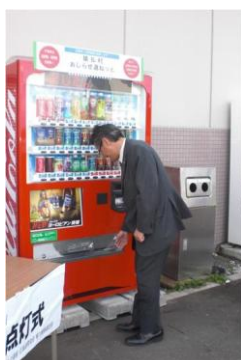
猿払村(道の駅さるふつ公園)