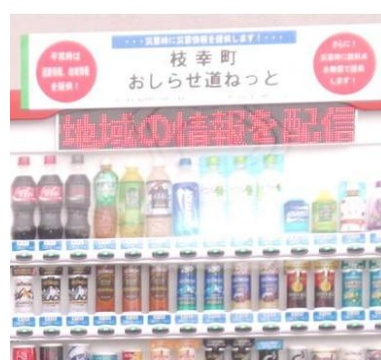
枝幸町(道の駅 マリーニア일랜드岡島)