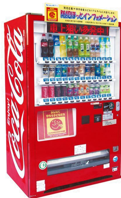
写真:「防犯ほっとインフォメーション」