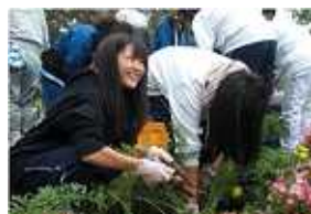
【2010年 収穫祭】 収穫した作物に、大人も 若者も大感激でした。