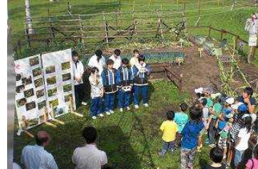
昨年度 学生達による活動報告

同プログラムは、2008年に当社と旭川市との間で締結した「魅力的なまちづくりに関する基本協定」に基づき、2010年から旭山動物園内 休憩スペース「やすらぎの森」横にて、旭山動物園と当社を含む協力関係者が協働して農園を開墾し、高校生をはじめとする市民が中心となって農作物の栽培を行うものです。