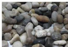
ため池底に小石を敷き、ホタルの幼虫のえさとなる「たにしの生息できる環境にする