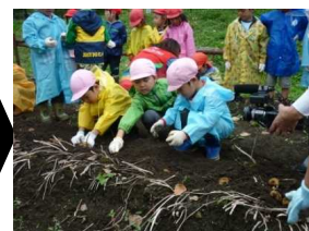
【2012年 収穫祭】 更なる農園拡張で、栽培可 能な作物が増え大満足。