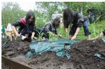
昨年度 農園開きの様子

開始4年目を迎える今年度は、「ホタルが生息できる環境づくり」を目指して、ため池による水の循環設備の整備を行うほか、新たに旭川農業高校に協力いただき、水田で稲の作付けを行います。