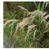
ため池周辺にヨシを植えホタルの環境づくり