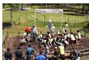
【2010年 開墾】 参加者が一体となって 取り組みました。