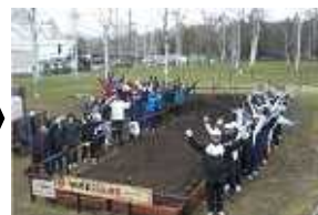
【2011年 農園拡張】 農園を大幅に拡張し、 参加者も拡大しました。