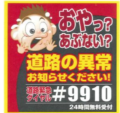
（※）道路緊急ダイヤル啓発ステッカー

この度、本協定の締結式および、道路緊急ダイヤルの啓発ステッカーを掲示した車両の出発式を下記の通り実施しますのでお知らせいたします。