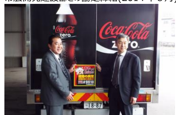
小樽開発建設部との協定締結(2015年4月)