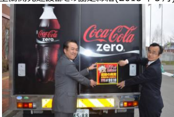
旭川開発建設部との協定締結(2015年4月)