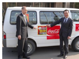
網走開発建設部との協定締結(2015年3月)