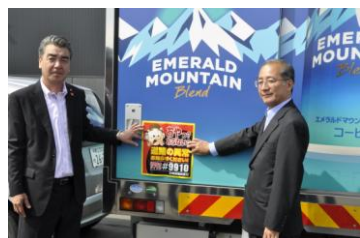
帯広開発建設部との協定締結(2014年8月)

その後、道内各地でも活動への気運が高まり、室蘭開発建設部、網走開発建設部、旭川開発建設部、小樽開発建設部と同様の協定を締結しました。この度、釧路開発建設部との協定締結によって道内6ヶ所目となります。道路緊急ダイヤルの啓発ステッカーを掲示した当社車両は合計400台となりました。