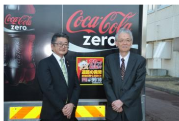
室蘭開発建設部との協定締結(2015年3月)