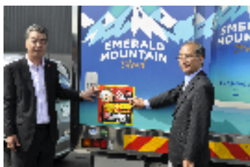
帯広開発建設部との協定締結(2014年8月)

その後、道内各地でも活動への気運が高まり、室蘭、網走、旭川、小樽、釧路の各開発建設部と同様の協定を締結しました。このたび、稚内開発建設部との協定締結によって道内7ヶ所目となります。道路緊急ダイヤルの啓発ステッカーを掲示した当社車両は合計420台となりました。