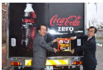
旭川開発建設部との協定締結(2015年4月)