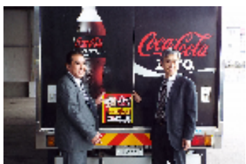
小樽開発建設部との協定締結(2015年4月)