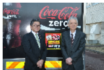
室蘭開発建設部との協定締結(2015年3月)