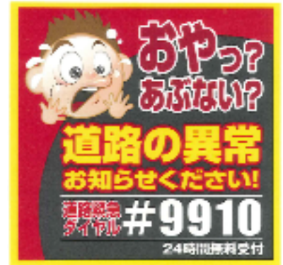
道路緊急ダイヤル啓発ステッカー

このたび、本協定の締結式および、道路緊急ダイヤルの啓発ステッカーを掲示した車両の出発式を下記の通り実施しますのでお知らせいたします。