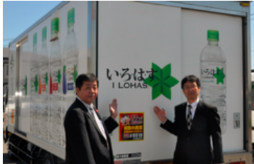
釧路開発建設部との協定締結 (2015年6月)