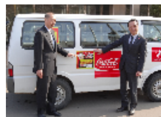
網走開発建設部との協定締結 (2015年3月)