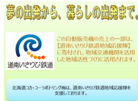
前面中心部の告知物