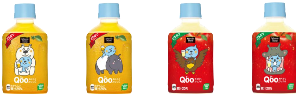
ミニッツメイド Qoo(クー)わくわくオレンジ/ミニッツメイド Qoo(クー)わくわくアップル (「ホッキョクグマ」「マレーバク」デザイン) (「オオワシ」「カバ」デザイン)

同製品のパッケージには、環境問題や食育への関心を持つきっかけになることを目的とし、札幌市の食育特別大使であるキャラクター「Qoo(クー)」と、同園で飼育展示されている動物(絶滅危惧種)である「ホッキョクグマ」「マレーバク」「オオワシ」「カバ」の4種が描かれており、札幌市とその周辺の地域限定で販売し、大変ご好評をいただいております。