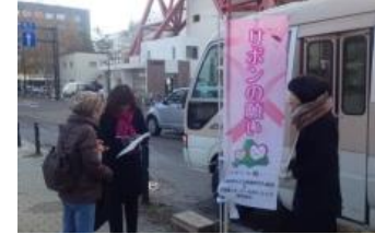
昨年のバスツアーの様子

また、寄付金の一部を活用した北海道対がん協会と当社が協働で行うピンクリボン啓発活動を「リボンの願い」とし、昨年度はピンクリボン啓発グッズ(オリジナル付箋)の作成や、無料乳がん検診バスツアーを開催するなど様々な取り組みを行っています。