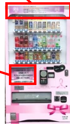
自動販売機のイメージ

当社は「北の大地とともに」をスローガンに、道産子企業として北海道の魅力をさらに高めるため、地域課題解決への協力や次世代を担う子どもたちに将来の地球の姿を考える場の提供、安全で安心な地域づくりを応援する取り組みなど、事業活動を通して継続的に推進してまいります。