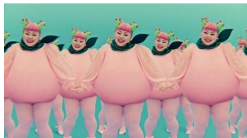
【渡辺さん】 ぷりぷりぷりぷりももっぷり♪