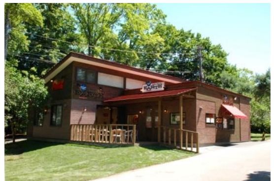
※nature café EARTH（ネイチャーカフェアース）