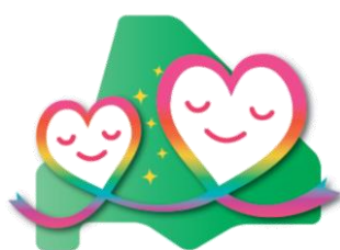
リボンの願い <ロゴマーク>

2016年からは当社工場見学やピンクリボン活動の講習会も含めた無料の乳がん検診バスツアーなどを実施しています。参加者からは「検診を受ける良いきっかけになった」という声が多く聞かれました。