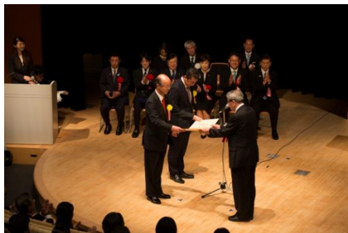
第19回 日本水大賞授賞式