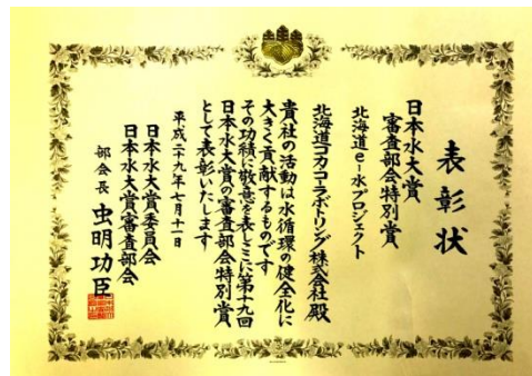
日本水大賞 審査部会特別賞