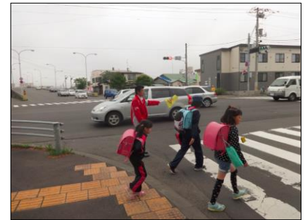
<釧路事業所での通学路見守りボランティアの様子>