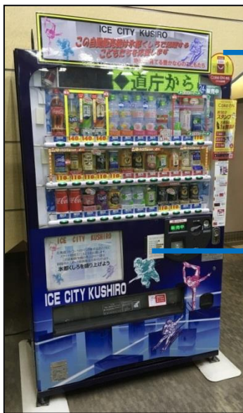
<氷都くしろ応援自販機>

また、当社釧路事業所では、子どもたちの通学路の見守りボランティアを毎日継続して実施しております。