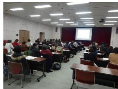
<ピンクリボンバスツアーの様子>