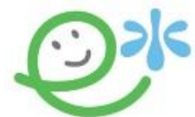
北海道e-水プロジェクト

「北海道e-水プロジェクト」は、2009年11月、北海道と当社との間で締結した「環境保全に関するパートナーシップ協定」に基づき、北海道の豊かで美しい「水」を中心とした自然環境を守り次世代へと引き継いでいくことを目的とし、北海道、公益財団法人北海道環境財団、当社の三者協働で取り組むプロジェクトです。