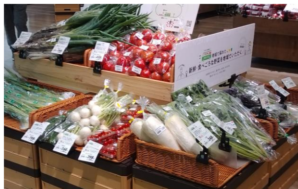
※イメージです。実際の売場ではございません。