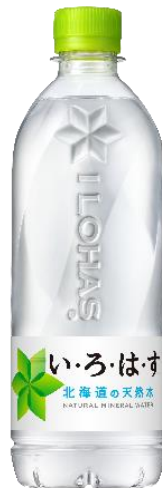
「い・ろ・は・す 天然水」 540ml PET

また、「い・ろ・は・す」くだものフレーバーウォーターシリーズも「い・ろ・は・す 天然水」と同様の新ボトルで、2022 年 6 月 20 日（月）より北海道で先行発売します。素材にこだわり、国産のおいしい果物のエキスを使用した本物の果実のようなおいしい味わいで幅広いお客様に支持されているフルーツフレーバーウォーター ブランドとして、今後も市場の成長を牽引してまいります。