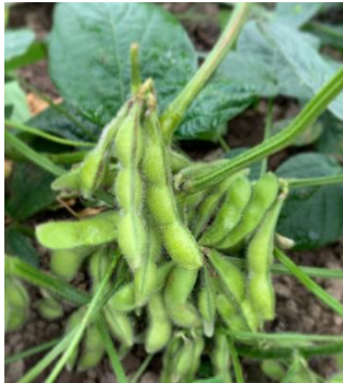
札幌伝統野菜「サッポロミドリ」