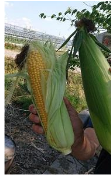
朝どれの「とうもろこし」