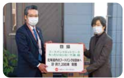
フードバンクネットワークもったいないわ・千歳様(右)はじめ、道内8団体を通じて当社製品が贈られました

※フードバンクとは、品質に問題がないにもかかわらず市場に流通できなくなった食品(「食品ロス」となる製品)の寄付を受けて、施設や団体などに無償で配給する活動団体です。