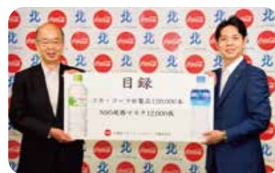
鈴木直道北海道知事(右)へ、佐々木康行社長から目録が贈られました

2020年5月、新型コロナウイルス感染症と向き合う医療従事者の方々への感謝と激励の思いを込めて、北海道内の感染症指定医療機関、道内保健所、北海道新型コロナウイルス感染症対策本部などに、「コカ・コーラ社製品(120,000本)」と「N95規格マスク(12,000枚)」を寄贈しました。