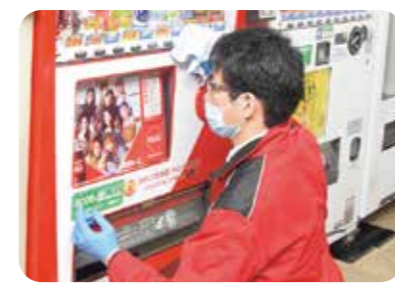
抗ウイルス・抗菌施工の様子

さらに、多くの方に安全安心をお届けするため、これを事業として拡大し、ご好評をいただいています。