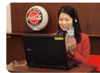
オンライン工場見学の様子

通常の工場見学では紹介していない「い・る・は・す天然水 555ml PET」の製造現場や、製造に用いる様々な機械を間近で見ているような映像をお届けするとともに、見学後は質問タイムを設け、児童の皆さまの疑問にお答えする新たなスタイルの工場見学です。