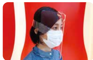
リサイクルPET素材から作られた簡易フェイスシールド

新型コロナウイルス感染症と向き合う医療従事者の皆さまの健康・安全管理をサポートすることを目的に、リサイクルPET素材を応用した簡易フェイスシールドを、公的団体を通じ北海道内の医療機関へ寄贈しました。