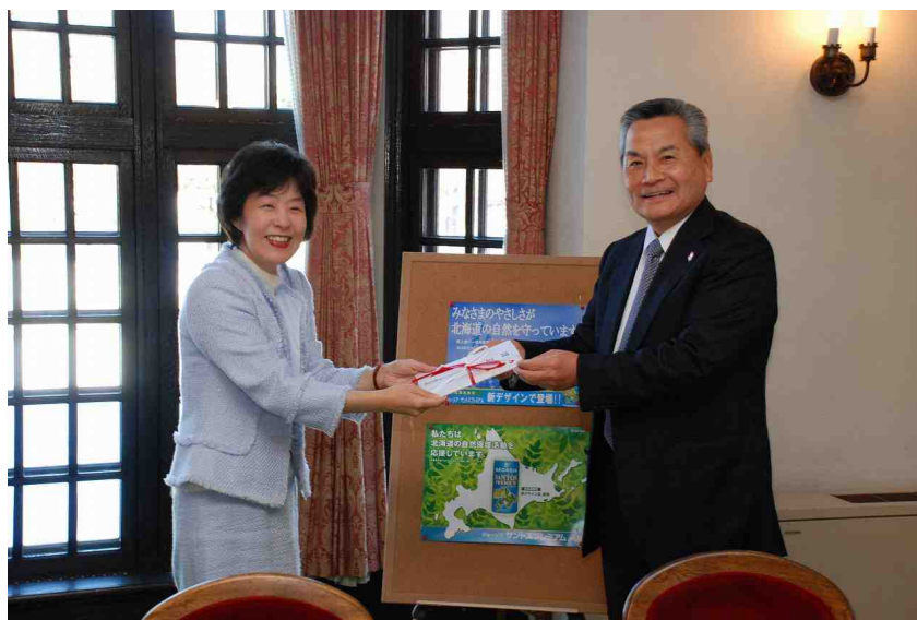
2008年11月26日の寄付金贈呈式

2008年11月26日（水）北海道コ・ラボ トリノグ 株式会社 代表取締役社長 角野中原が知事公館を表敬訪問し、2008年5月12日～2008年11月11日までの売上金の一部 6,398,130円（12,796,260本相当）（年間12,079,905円）を高橋はるみ知事へ贈呈いたしました。