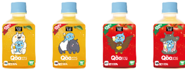
ミニッツメイド Qoo(クー) わくわくオレンジ / ミニッツメイド Qoo(クー) わくわくアップル (「ホッキョクグマ」「マレーバク」デザイン) (「オオワシ」「カバ」デザイン)

同製品は、昨年4月より、札幌市とその周辺の地域限定で販売しており、パッケージには、環境問題や食育への関心を持つきっかけになることを目的に札幌市食育特別大使であるキャラクター「Qoo(クー)」と、同園で飼育展示されている動物(絶滅危惧種)である「ホッキョクグマ」「マレーバク」「オオワシ」「カバ」の4種が描かれています。