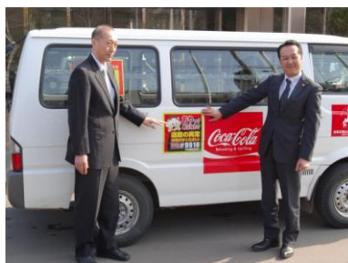
網走開発建設部との協定締結 (2015年3月)