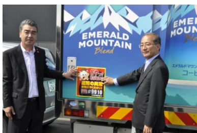
帯広開発建設部との協定締結 (2014年8月)

2014年8月20日、十勝管内の国道における幹線道路の異常等の情報共有及び道路緊急ダイヤルの啓発活動に関する協定を、北海道開発局帯広開発建設部と当社帯広事業所との間で締結しました。また、2015年3月18日に室蘭開発建設部と当社苫小牧事業所、3月19日に網走開発建設部と当社北見販売部も同様の協定を締結し、この取り組みを順次拡大して参りました。ステッカーの掲出車両の台数は、この度の旭川開発建設部、小樽開発建設部との協定に基づく取り組み開始によって合計330台となりました。