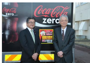
室蘭開発建設部との協定締結 (2015年3月)