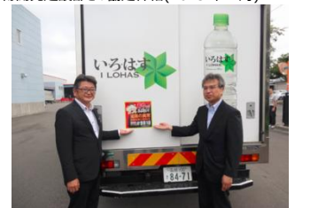
函館開発建設部との協定締結(2015年7月)