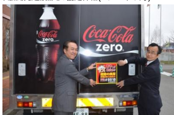
旭川開発建設部との協定締結(2015年4月)