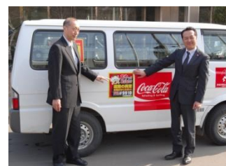
網走開発建設部との協定締結(2015年3月)