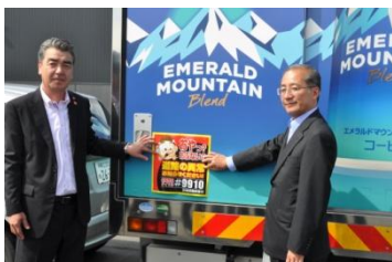
帯広開発建設部との協定締結(2014年8月)

この度、留萌開発建設部との協定締結によって道内9ヶ所目となります。道路緊急ダイヤルの啓発ステッカーを掲示した当社車両は合計約520台となりました。