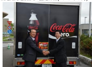
稚内開発建設部との協定締結(2015年7月)