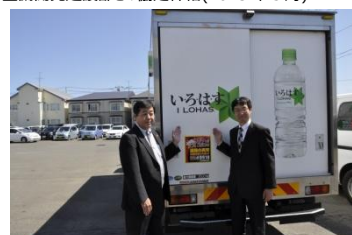
釧路開発建設部との協定締結(2015年5月)