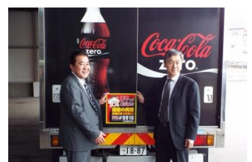
小樽開発建設部との協定締結(2015年4月)