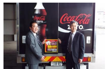
小樽開発建設部との協定締結(2015年4月)