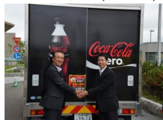
稚内開発建設部との協定締結(2015年7月)