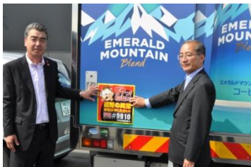
帯広開発建設部との協定締結(2014年8月)

2014年8月、「『道路異常の情報共有及び道路緊急ダイヤルの啓発活動』における協働事業の実施に関する細目協定書」を、北海道開発局帯広開発建設部と当社帯広事業所との間で締結しました。その後、道内各地でも協働事業への気運が高まり、室蘭開発建設部、網走開発建設部、旭川開発建設部、小樽開発建設部、釧路開発建設部、稚内開発建設部、函館開発建設部と同様の協定を締結しました。そして、8月18日に留萌開発建設部、8月19日に札幌開発建設部との協定締結によって、道内すべての開発建設部との協働事業が実現いたします。道路緊急ダイヤル啓発ステッカーを掲示した当社車両は合計約970台となりました。