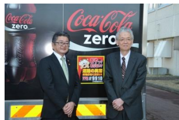
室蘭開発建設部との協定締結(2015年3月)