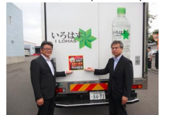
函館開発建設部との協定締結(2015年7月)