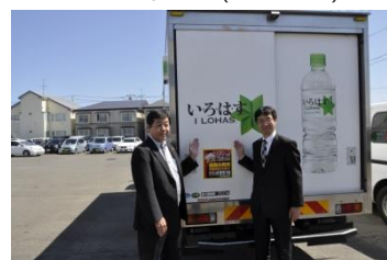
釧路開発建設部との協定締結(2015年5月)