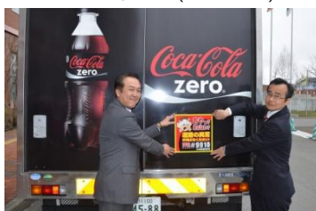
旭川開発建設部との協定締結(2015年4月)