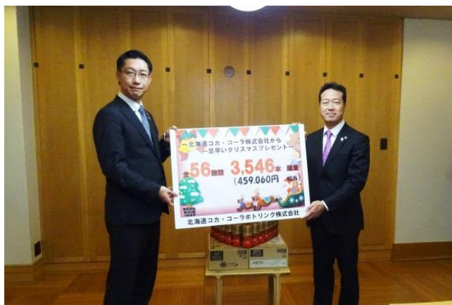
【昨年の寄贈式の様子】

旭川市へは、本日12月16日(水)、旭川市保健福祉部に3,084本(407,520円相当)が寄贈されました。寄贈した製品は、旭川市保健福祉部を通して、市内54の社会福祉施設に届けられます。