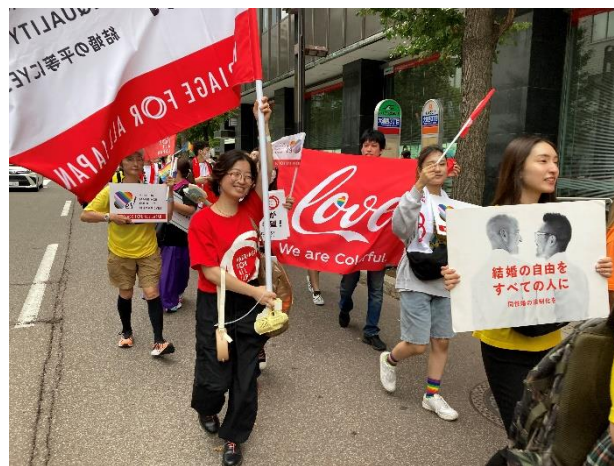
<さっぽろレインボープライド2023の様子>

「多様性の尊重」を掲げる日本のコカ・コーラシステムでは、「ジェンダー」「年齢/世代」「障がい者支援」「LGBTQ」の分野において幅広い取り組みを推進しています。なかでも「LGBTQ」においては、2021年にシステム全社において、戸籍上同性のパートナーにも対応した福利厚生および就業規則の整備を完了しています。2022年には、多様性の尊重に関する取り組みの一環として「LGBTQ+アライ *1 のためのハンドブック」を策定して、全国約2万人のコカ・コーラシステムの従業員に配布されました。