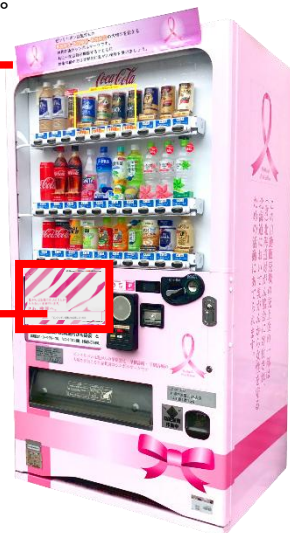
<自動販売機のイメージ>