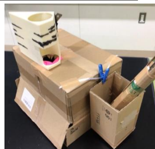
学生が自作した試作品第一号

「札幌開成9期資源再生プロジェクト」の取組は、公益財団法人コカ・コーラ教育・環境財団が実施している「コカ・コーラ環境教育賞」への応募から始まりました。そこで学生が電気やエネルギーを使用しないということをテーマに、3Dプリンターや段ボールを使って試作した「ラベル剥離器」が原点です。そこから円山動物園様・学生の皆様と意見交換により、試作品の改良を重ね、誰もが楽しくPETボトルの分別を体験できる器械として完成いたしました。「ラベル剥離器」は除幕式終了後から、どなたでも体験いただけますので、ぜひお気軽にご利用ください。